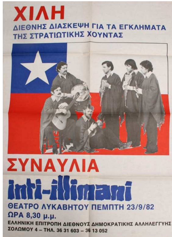
1.3. Cartel de la audiencia en Atenas con presentación de Inti Illimani en Atenas (1982)