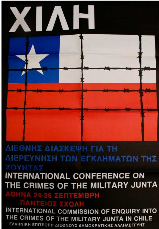
1.2 Cartel de la audiencia en Atenas (1982)