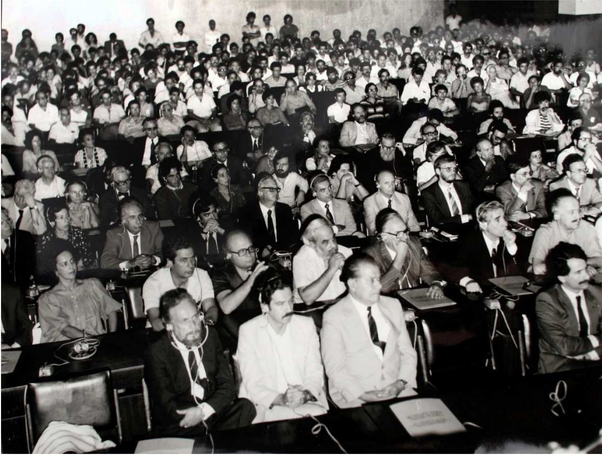
1.5. Asistentes a la audiencia sobre derechos humanos realizada en Atenas (1982)