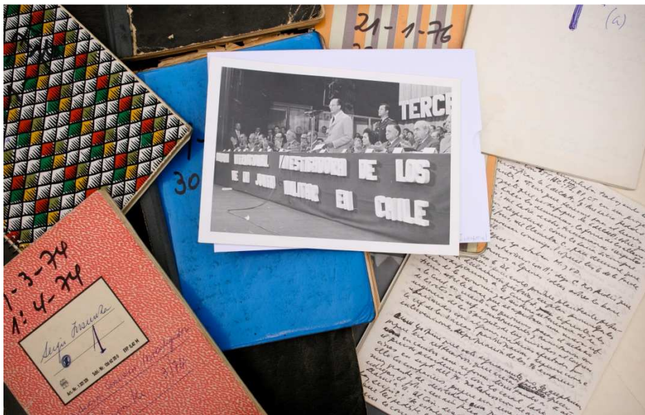
1.4 Cuadernillos, fotografía y documentos del Fondo Insunza